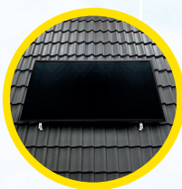
Opdak (horz. / vert.)